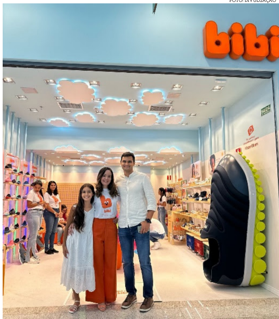
Franqueada da Calçados Bibi e família