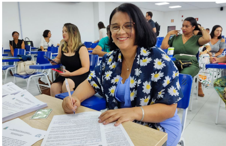
Última posse dos profissionais de Educação concursados