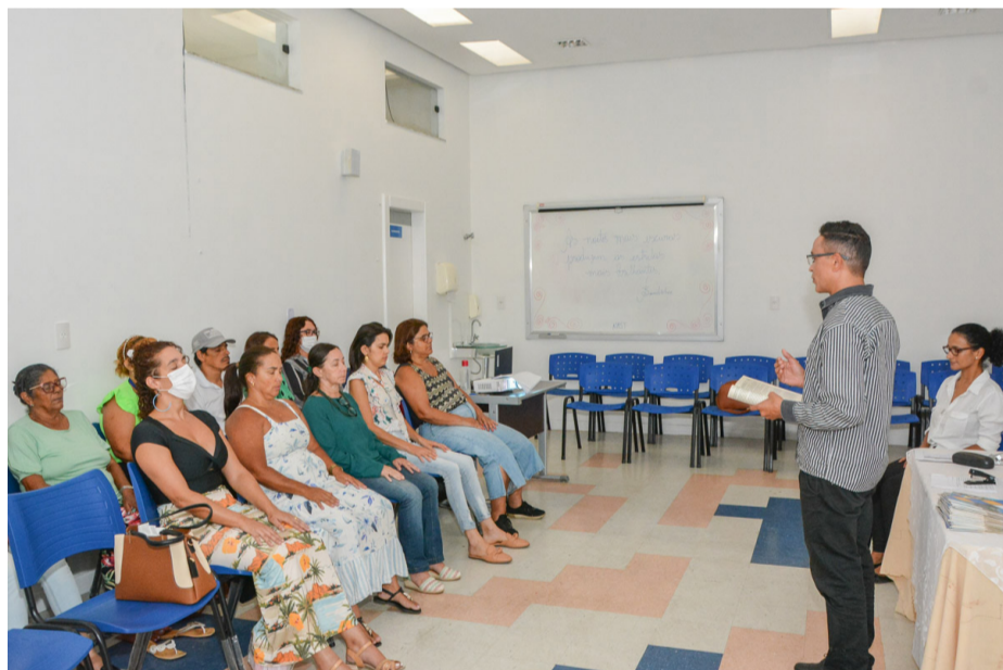
Grupo terapêutico para servidores públicos municipais