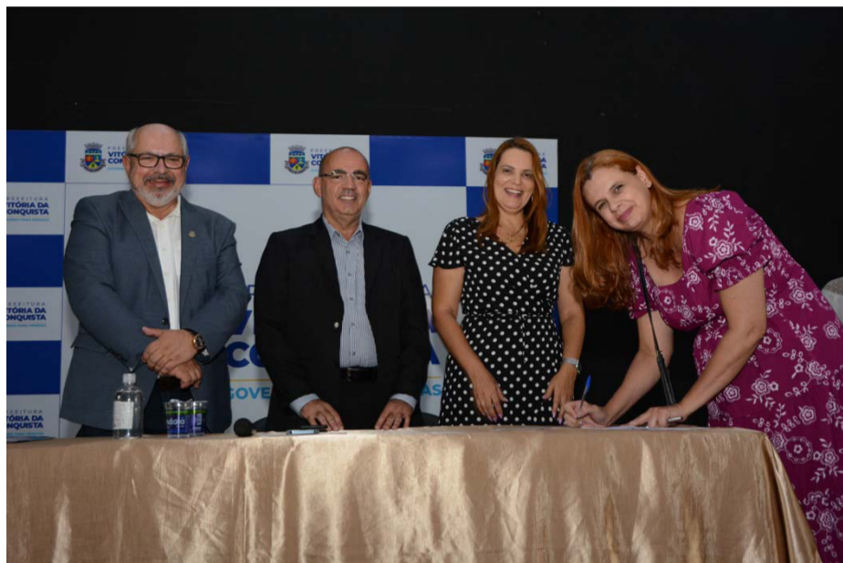
1ª Posse dos profissionais de Educação concursados

Outra ação importante foi a Lei nº 2.717 em 2022, que cria estratégias e programas que contribuem para a realização e aperfeiçoamento dos servidores municipais. Convênios também foram firmados com instituições de ensino para garantir descontos aos servidores em cursos de graduação e pós-graduação. Ainda foi ampliado o programa no qual empresas fornecem produtos e serviços com descontos aos servidores municipais.