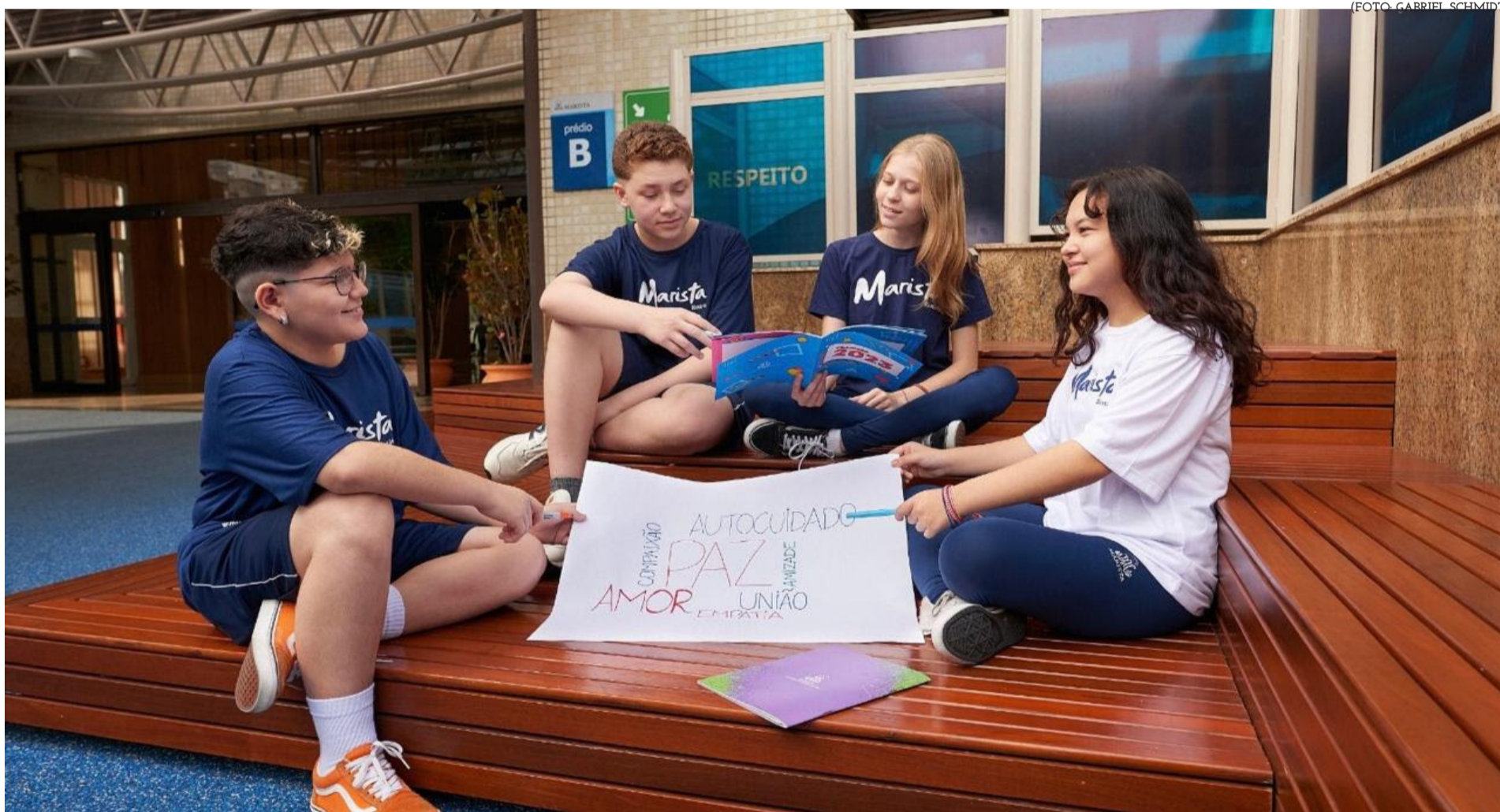
É PAPEL DA ESCOLA PROPORCIONAR UM AMBIENTE DE ACOLHIMENTO, CUIDADO, RESPEITO MÚTUO E PROMOVER AÇÕES QUE COMBATEM QUALQUER TIPO DE VIOLÊNCIA

Outro movimento dos pais e responsáveis que merece atenção é quanto à orientação de como os estudantes devem resolver os conflitos ou problemas que surgem dentro do ambiente escolar. Henrique Brojato salienta que "é imprescindível que a família compreenda e esteja de acordo com os valores e a cultura da escola". Por último, o psicólogo cita a importância de buscar orientação de um profissional, caso os pais percebam que seus filhos precisam de apoio emocional ou psicoterapia.