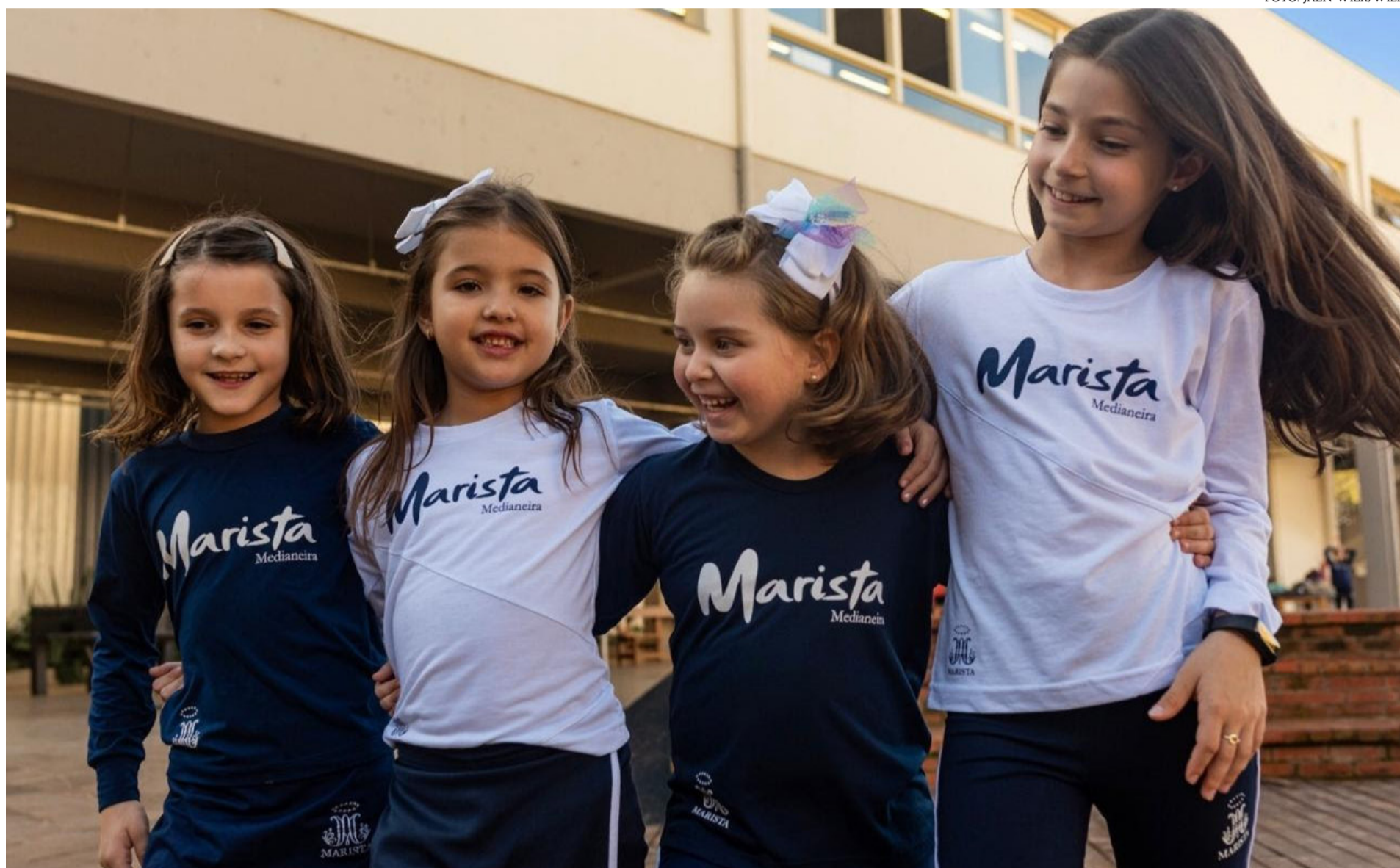
Combater o bullying é essencial para garantir um ambiente escolar saudável e feliz