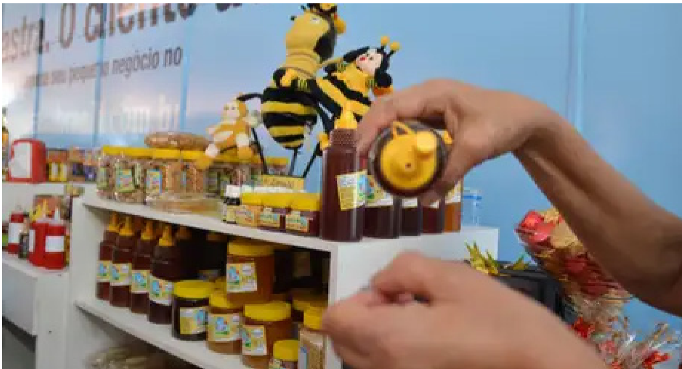
Desenrola Pequenos Negócios oferece incentivos.

A ação faz parte do Programa Desenrola Pequenos Negócios, uma iniciativa do Ministério da Fazenda, Ministério do Empreendedorismo, da Microempresa e da Empresa de Pequeno Porte com o apoio da Federação Brasileira de Bancos (Febraban). Essa parcela atendida é a mesma que precisa de ajuda para renegociar as dívidas e obter recursos para manter as atividades.