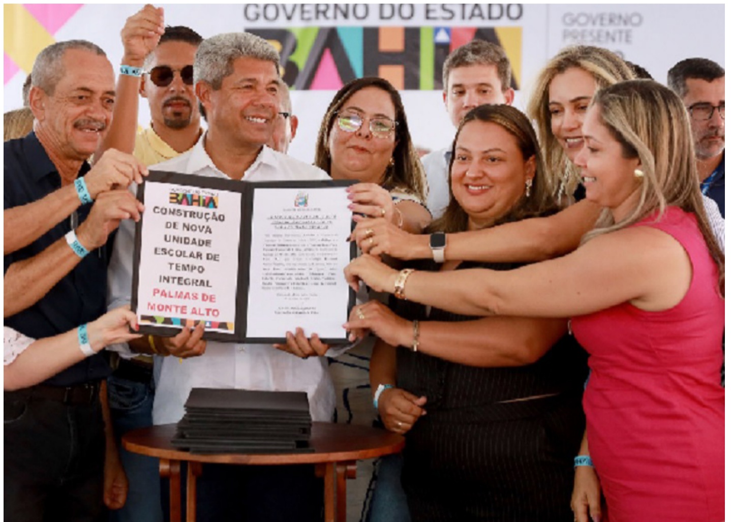
– Jerônimo Rodrigues autorizou R$ 129,8 milhões em investimentos para construção da Unidade Escolar de Tempo Integral que vai sediar o Colégio Estadual Anísio Teixeira.

Durante o ato público o governador anunciou e autorizou importantes investimentos no município. Na área da Educação, Jerônimo Rodrigues autorizou a Secretaria de Estado de Educação a deflagrar o Processo Licitatório para construção da nova Unidade Escolar de Tempo Integral para sediar o Colégio Estadual Anísio Teixeira. Com investimentos previstos da ordem de R$ 19,8 milhões, financiados com recursos do Novo PAC (Programa de Aceleração do Crescimento), a nova Unidade de Ensino terá 13 Salas de Aula, Bloco Administrativo, 4 Salas Multifuncionais/Laboratórios, Biblioteca, Pátio Coberto, Restaurante Estudantil, Teatro, Vestiário, Quadra Poliesportiva Coberta e Campo de Futebol com Pista de Atletismo.