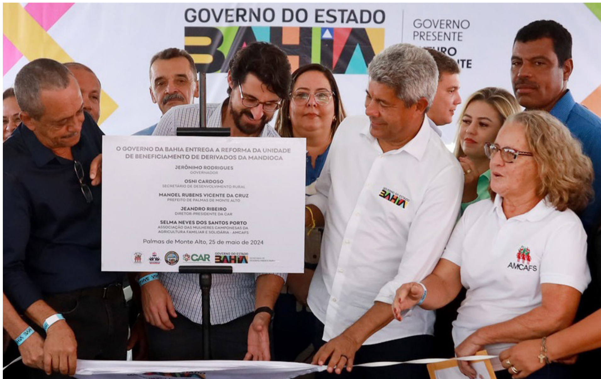
– Jerônimo Rodrigues fez a entrega das obras de adequação e ampliação da Unidade de Beneficiamento de Derivados de Mandioca da Comunidade da Associação de Mulheres Camponesas da Agricultura Familiar e Solidária (Amcafs).

Ainda em Palmas de Monte Alto, no ato público que marcou a visita do governador ao município, o Governo do Estado da Bahia, no âmbito do Projeto Bahia Mais Forte, Terra Legal, operacionalizado pela Superintendência de Desenvolvimento Agrário, órgão da estrutura da Secretaria de Estado de Desenvolvimento Rural da Bahia, foram entregues 10 Títulos de Regularização Fundiária. Jerônimo Rodrigues também fez a entrega da obra de adequação e ampliação da Unidade de Beneficiamento de Derivados de Mandioca da Comunidade da Associação de Mulheres Camponesas da Agricultura Familiar e Solidária (Amcafs), na Comunidade de Boa Vista. As intervenções foram executadas pela Secretaria de Estado do Desenvolvimento Rural da Bahia, através da Companhia de Desenvolvimento e Ação Regional (CAR), no âmbito do Programa Bahia Produtiva.