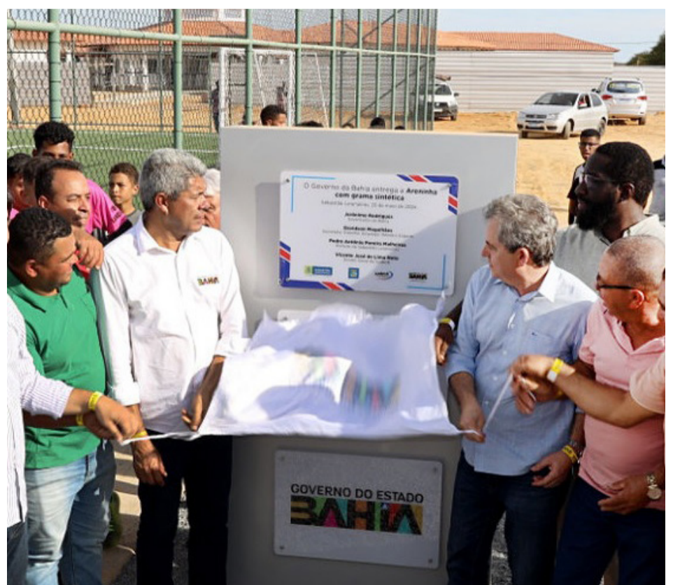
Inauguração da Areninha Society no Distrito de Mandiroba (Mamonas).