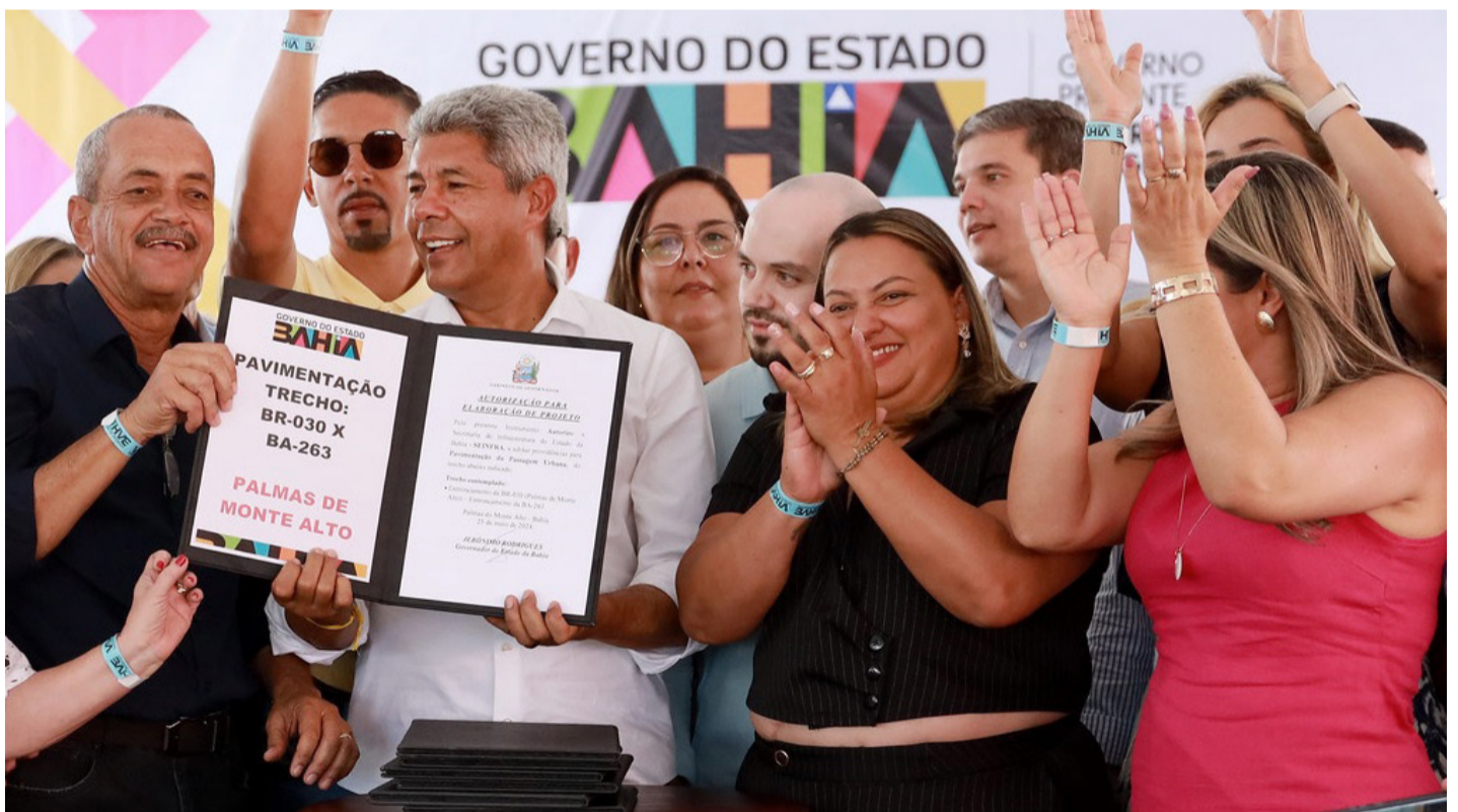
A secretaria de Estado de Infraestrutura de Transporte, Energia e Comunicação da Bahia foi autorizada pelo governador a elaborar o projeto para pavimentação do trecho de 45 quilômetros entre o entroncamento da BR-030 e o entroncamento da BA-263 (Palmas de Monte/Sebastião Laranjeiras) no Distrito do Espriado.

Na área da Infraestrutura, o governador assinou a autorização para a Secretaria de Estado de Infraestrutura de Transporte, Energia e Comunicação da Bahia elaborar os Projetos para pavimentação da passagem urbana e do trecho de 45 quilômetros entre o entroncamento da BR-030 e o entroncamento da BA-263 (Palmas de Monte/Sebastião Laranjeiras) no Distrito do Espriado. Outra intervenção na área da Infraestrutura Viária autorizada pelo governador foi a pavimentação das vias públicas nos acessos a Unidade Integrada de Segurança Pública, a construção de uma ponte sobre o Rio das Rãs, além de outros dois trechos da BR-030.