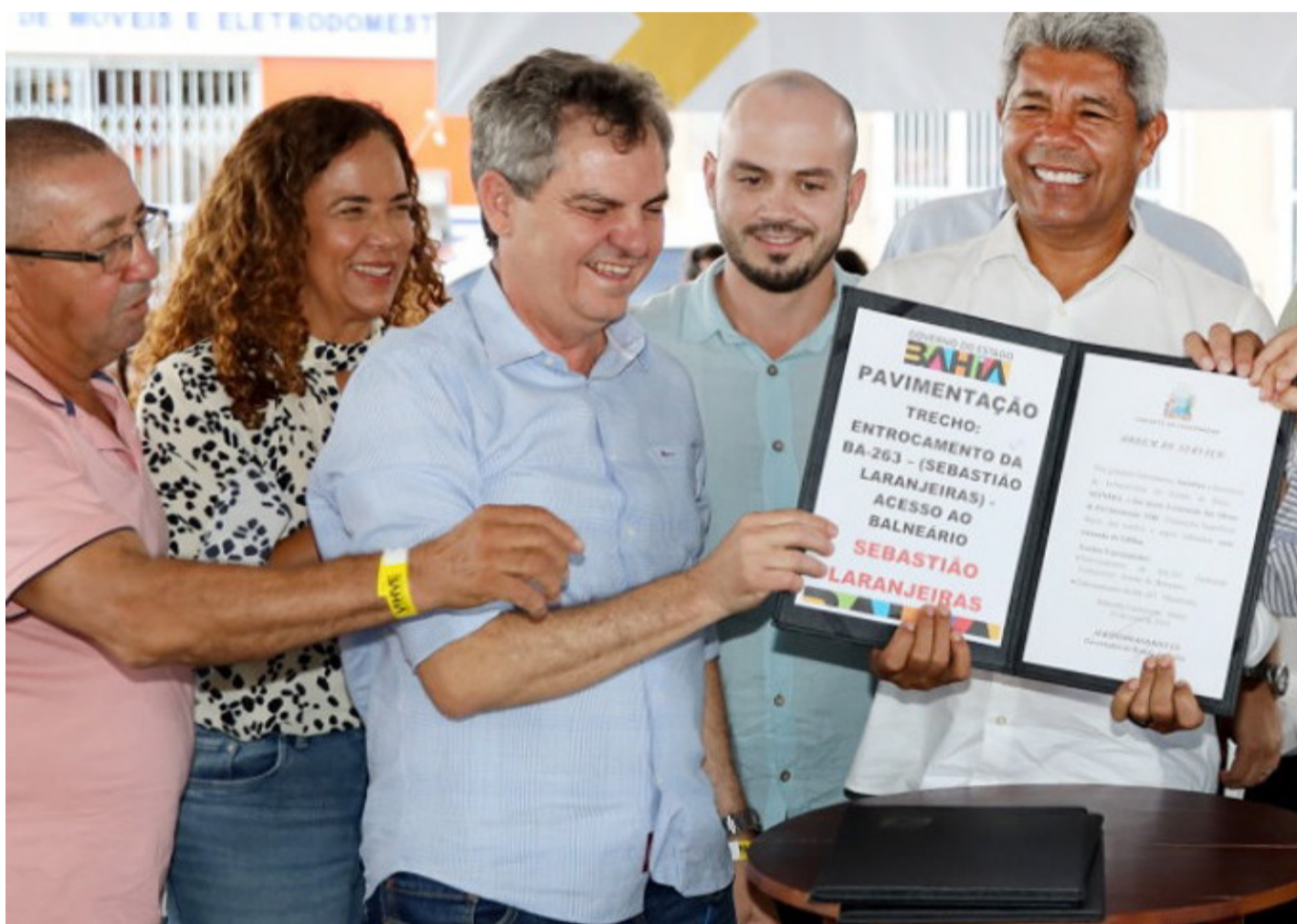
Governador assinou autorização para início das obras de pavimentação do trecho do entroncamento da BA-263 a Sebastião Laranjeiras (acesso ao Balneário).

(*) COM INFORMAÇÕES DA SECRETARIA DE ESTADO DE COMUNICAÇÃO SOCIAL DA BAHIA