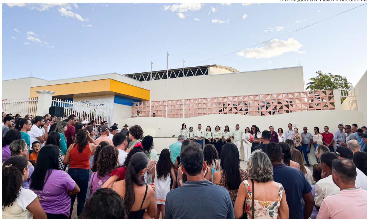
Inaugurada a nova sede do Núcleo de Atendimento Educacional Especializado Florescer.

A Prefeitura Municipal de Caculé, através da Secretaria Municipal de Educação, Cultura, Esporte e Lazer, inaugurou, na última quarta-feira, 19, a sede própria do Núcleo de Atendimento Educacional Especializado Florescer, espaço com salas de recursos multifuncionais e ambientes dotados de equipamentos, mobiliários e materiais didáticos e pedagógicos que atendem alunos com dificuldades de Aprendizagem, Deficiência, Transtornos Globais do Desenvolvimento e Altas Habilidades ou Superdotação, matriculados na rede pública municipal de Ensino. Financiado com recursos próprios, a construção da nova sede do Núcleo Florescer e a aquisição de mobiliários, equipamentos de Informática, brinquedos educativos e kits de Inclusão Especial exigiu investimentos superiores a R$ 1,920 milhão.