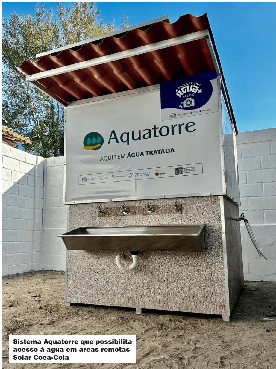
Sistema Aquatorre que possibilita acesso à água em áreas remotas Solar Coca-Cola

CONTATO PARA IMPRENSA COCA-COLA BRASIL: imprensacoca-cola@edelman.com